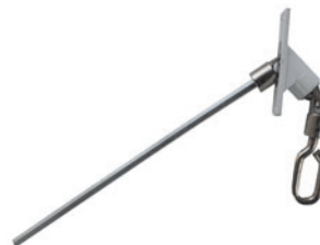
numer katalogowy: 12.53.003.01