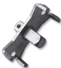
numer katalogowy: 12.42.005.01