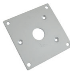
numer katalogowy: 12.24.ZB-MA-B