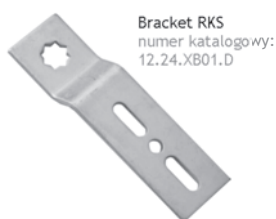
Bracket RKS numer katalogowy: 12.24.XB01.D